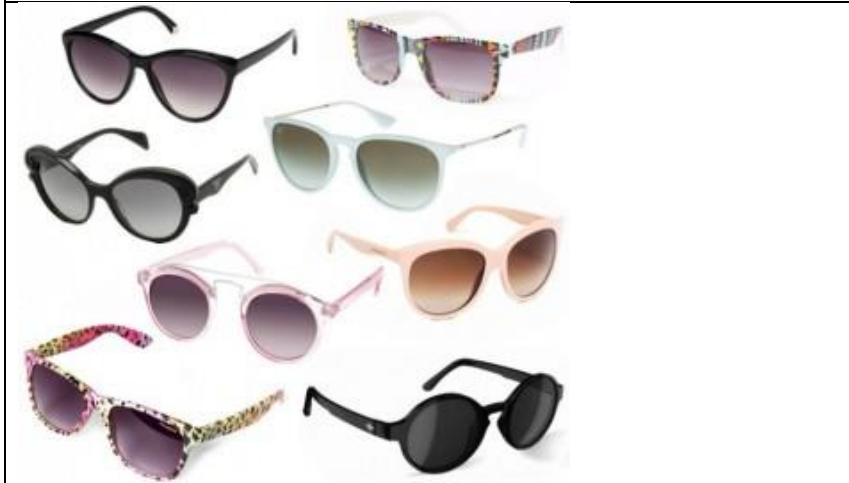
DES LUNETTES DE SOLEIL