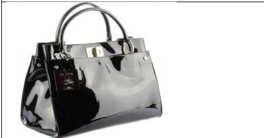
UN SAC A MAIN EN CUIR